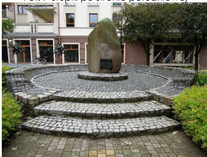
Fot. 8 Postument pomnika.