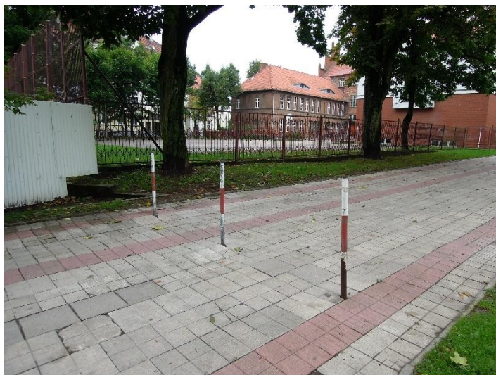
Fot. 7 Słupki po stronie południowej