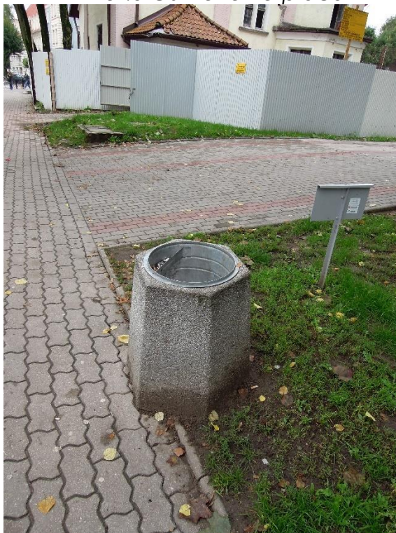
Fot.6 Kosz na śmieci, znak informacyjny po stronie południowo-wschodniej.