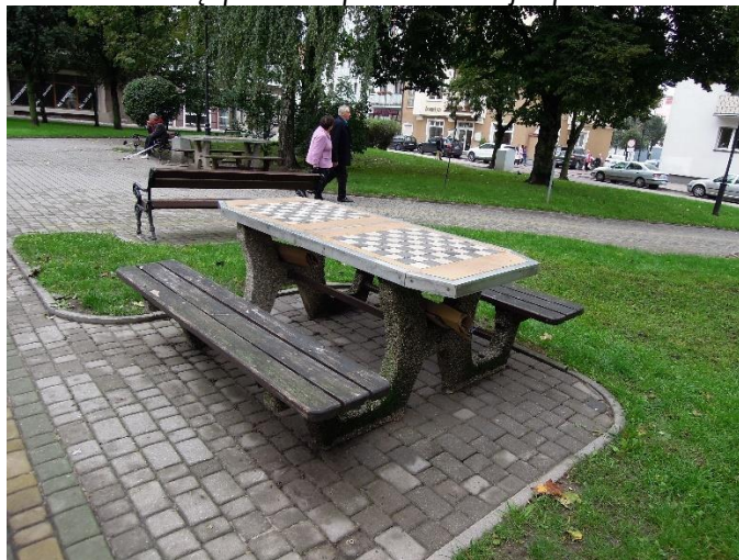
Fot. 2 Istniejąca mała architektura – siedziska i stoły.