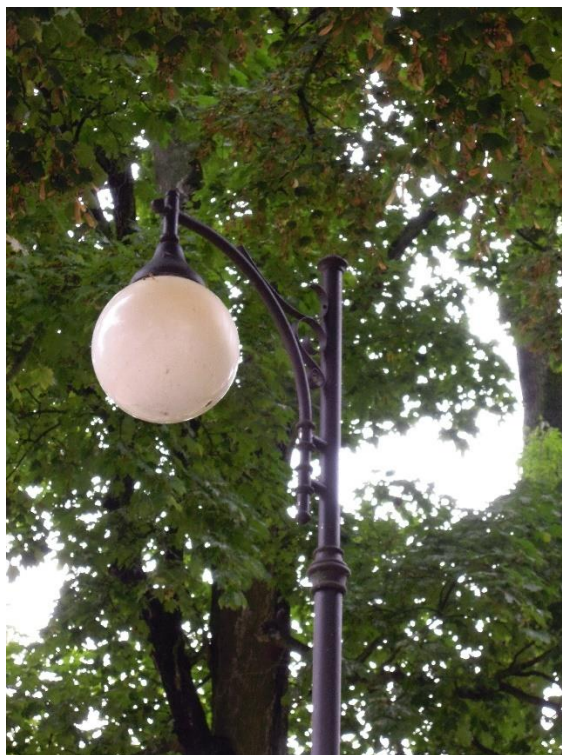
Fot.5 Oświetlenie placu