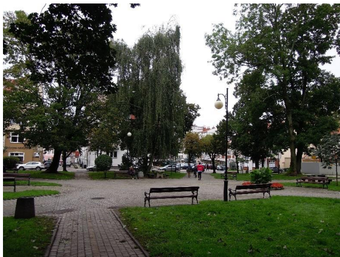
Fot. 3 Widok w stronę wschodnią.