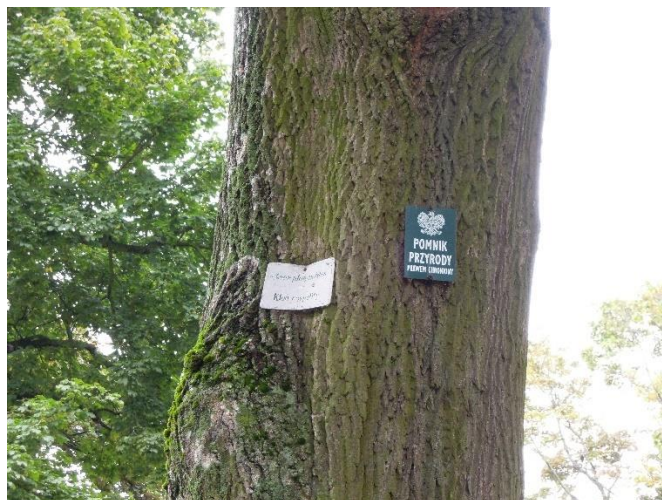
Fot.4 Jeden z trzech pomników przyrody